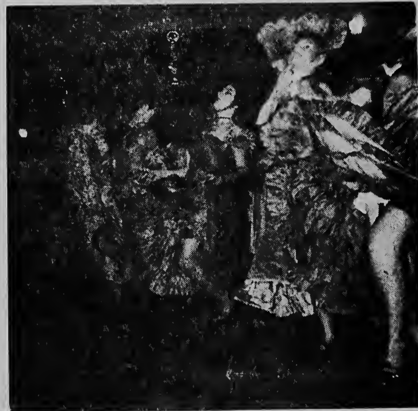
Aki nos lectionan por weita e ballarinanan di e can-can floorshow.

E bar cu a bira basta masha grandi cu den fondo un pintura di Padu Lampe di e strand, tambe a coscha masha interes y admiracion. E bishitanan a haurci bon uso di e confort cu e bar nobo aki ta ofrece awor. Pesei no ta cos extraño cu e fiesta a dura te banda di cinco'or di mainta.